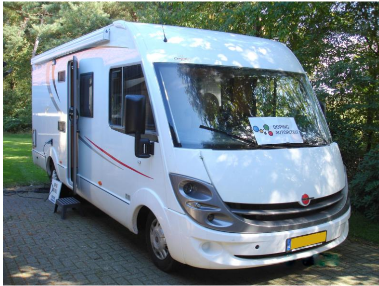
Het mobiele dopingcontrolestation

In die gevallen waar het niet mogelijk is een dopingcontrolestation in te richten, beschikt de Dopingautoriteit over een mobiel dopingcontrolestation. Op initiatief van de Dopingautoriteit kan dit station ingezet worden.